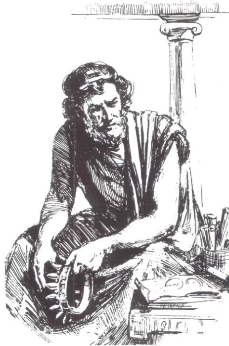
Архимед (287–212. г. пре н. е.) највећи математичар, физичар и инжењер старог века и један од највећих математичара свих времена